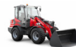
6680 Z-3 55 kW (75 CV)