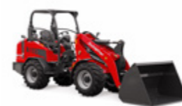
4670 Z-2 48,6 kW (66 CV)

Les performances particulières des chargeuses Schäffer sont reconnues par leurs utilisateurs de par la qualité de construction optimisée. Nos machines améliorent votre productivité. Des chargeuses à efficacité intégrée, chez Schäffer bien sûr !