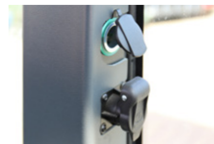
Prise de courant de 12 volts pour le chargement d'un appareil mobile / prise de courant pour appareil à 3 broches