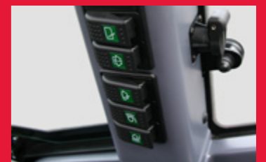
Interrupteurs regroupés – Prise 12V