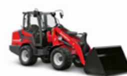
5680 Z 55 kW (75 CV)