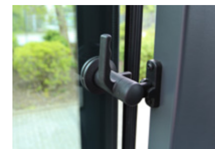
Vitres latérales ouvrables