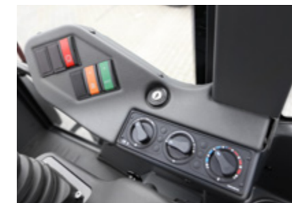
Clé de contact, la commande de chauffage et la climatisation en option sont facilement accessibles.