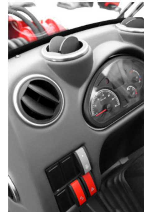
Des sorties d'air supplémentaires et plus grandes pour une circulation d'air optimale / série de commutateurs optimisée