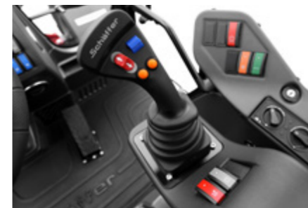
Joystick avec une fonctionnalité étendue