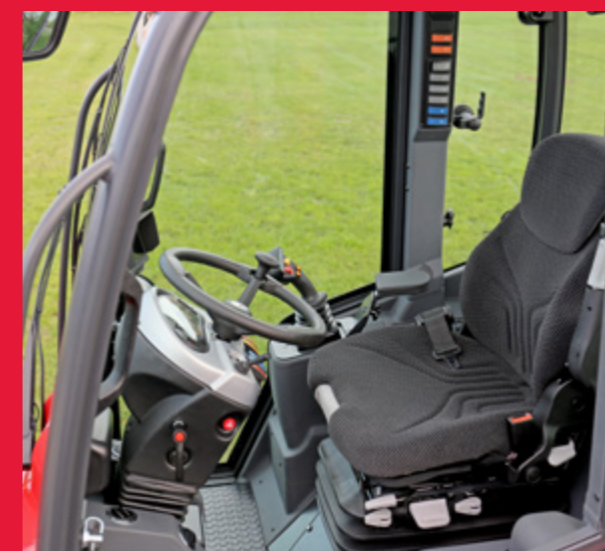
La nouvelle cabine offre plus d'espace et une visibilité encore optimisée.